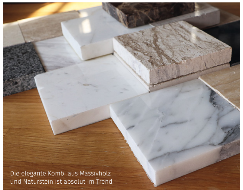
Die elegante Kombi aus Massivholz und Naturstein ist absolut im Trend

flächengestaltungen, Bodenbeläge, Wandverkleidungen, Abdeckungen in Küchen und Bädern, Spas und Wohnräumen werden gestaltet. Duschen, Waschbecken und Waschtische können wunderschön in Naturstein geformt werden. Aber auch Möbelstücke und Accessoires lassen sich aus diesem Material herstellen und bieten ausdrucksstarke Details. Jeder Naturstein ist ein Unikat. Abhängig von der Dichte der Steine sind sie wie Granit äußerst langlebig oder verändern sich wie Sandstein im Laufe der Zeit. Für ein angenehmes Laufgefühl sollte darauf geachtet werden, dass die Steine möglichst eben sind. Naturstein eignet sich nicht nur als Bodenbelag, ➔