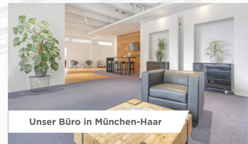
Unser Büro in München-Haar