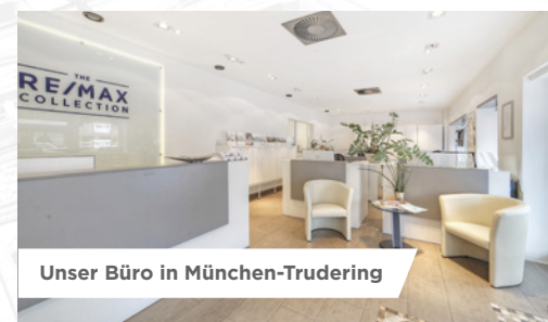
Unser Büro in München-Trudering