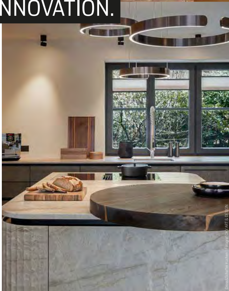
Dross&Schaffer Küchen

Die Küchenstudios der Dross&Schaffer Gruppe zählen zu den ersten ihrer Art vor Ort. Ihr Antrieb ist es, jederzeit aus der Tradition schöpfen zu können, um die Küche von morgen innovativ und mutig zu gestalten – verlässlich und stabil an der Seite der Kunden. Die Anlaufstelle für anspruchsvolle Küchenunikate.